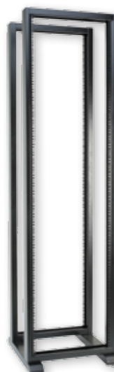
RS-42, RS-42, RS-P